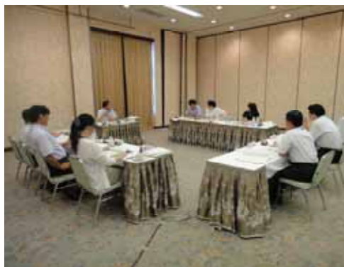
新みやざき創造戦略評価委員会の様子

つまり、 進捗評価と成果評価に乖離が見られる場合こそ、行政施策の改善の機会となる ことになる。世の中は変化している。マニフェストで掲げられた項目の数々の前提条件が、その時々々の社会状況、経済状況などで、悪い方向にも、よい方向にも変わってしまうこともある。その前提条件の変化に、いかに対応し、有権者の思いをいかに、行政サービスに反映していくかということも欠かせないことであろう。こういった評価の取り組みはシンプルでありながら、とても効果的で、実践的な工程管理の方法だと思われる。